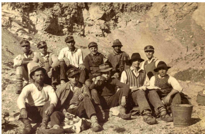
Fotografie din colecția artistului plastic Maxim Dumitraș