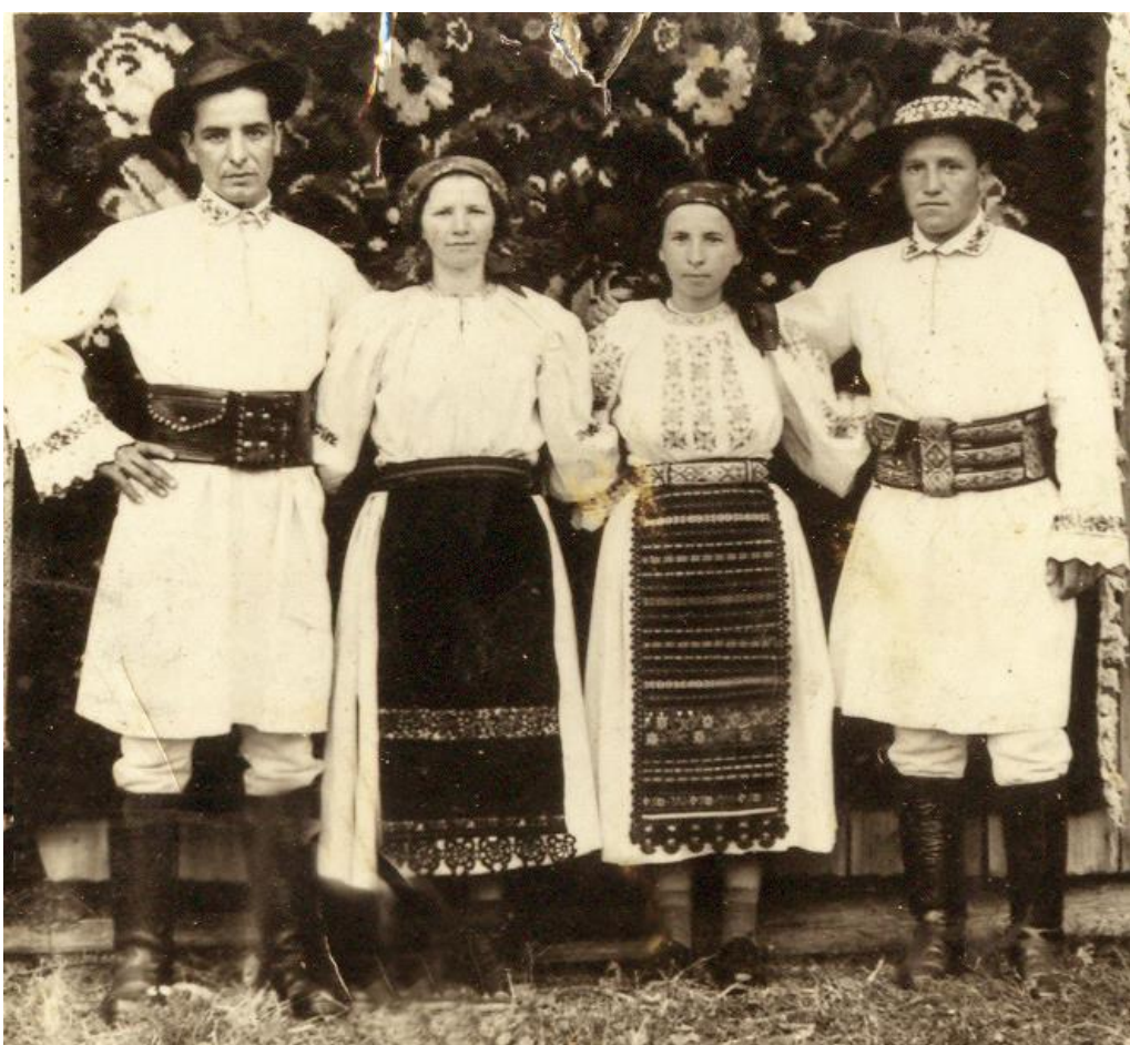
Fotografie din colecția artistului plastic Maxim Dumitraș